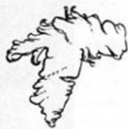
Ил. 4. Воздушная форма согласного «t» (фото и прорисовка И. Цинке).