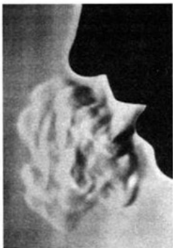
Ил. 3. Воздушная форма гласного звука «а» (фото И. Цинке).

Первым на эти незримые, порождаемые речью воздушные формы указал в 1924 г. Рудольф Штайнер 141 . Его замечание, что сделать их зримыми безусловно возможно, пользуясь соответствующими средствами, в 1962 г. было реализовано дрезденской учительницей Иоганной Цинке. Десятилетиями изучая эту тему, она смогла показать, что каждый звук речи и впрямь порождает перед ртом особенную, характерную только для него воздушную форму, причем явление это закономерно воспроизводится. Чтобы зримо отобразить отдельные формы и зафиксировать их с помощью фотоаппарата, Цинке поначалу использовала явление естественной конденсации пара при температурах ниже нуля. Но намного эффективнее оказался другой метод — перед произнесением какого-либо звука нужно было вдохнуть немного табачного дыма. Тогда возникающая воздушная форма оказывается насыщенной частицами дыма, и ее без труда можно видеть при комнатной температуре. Другим способом визуализации могут служить снимки, сделанные при помощи прибора Тёплера и интерферометра. (Снимок на ил. 3 сделан при помощи прибора Тёплера, остальные -обычные снимки выдыхаемого табачного дыма.