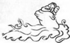
Ил. 5. Воздушная форма полугласного «w» (фото и прорисовка И. Цинке).

(как назвала их Цинке) были засняты на пленку высокоскоростной камерой. Тут можно было увидеть, как каждая форма в течение долей секунды возникает, достигает полного объема и